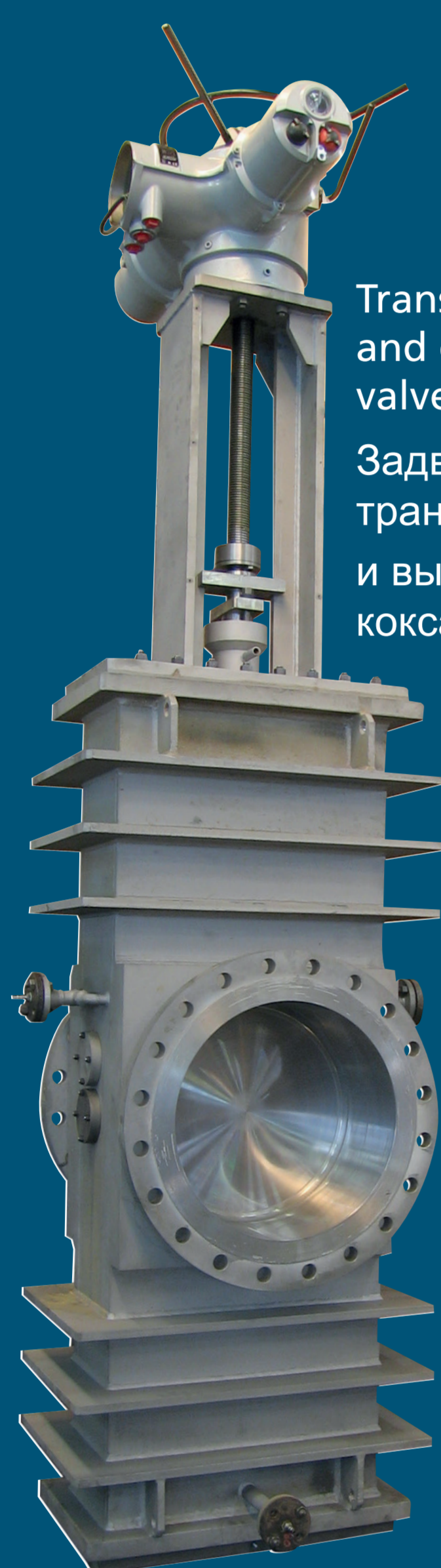
Transfer line and decoke valve